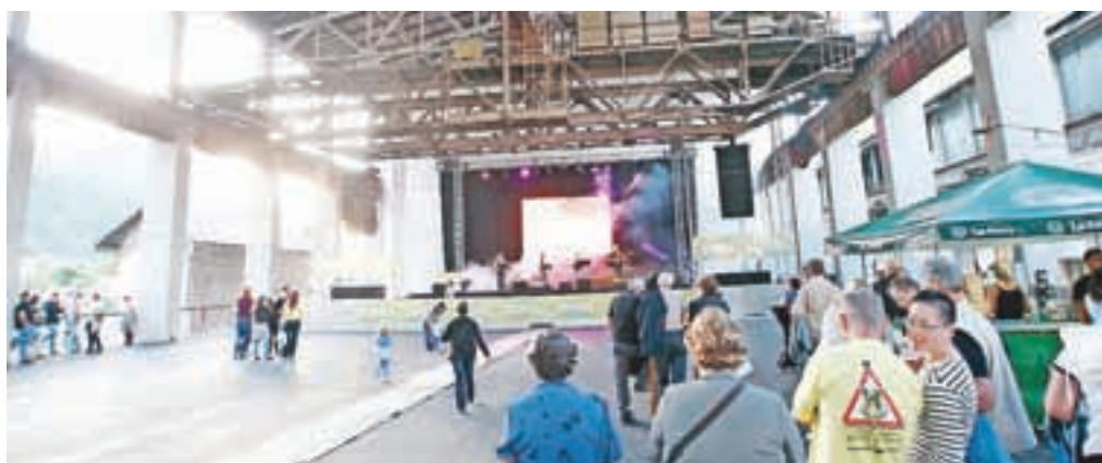
Prizorišče na Stari Savi: v času EuroBasketa 2013 je gostilo navijaško cono.