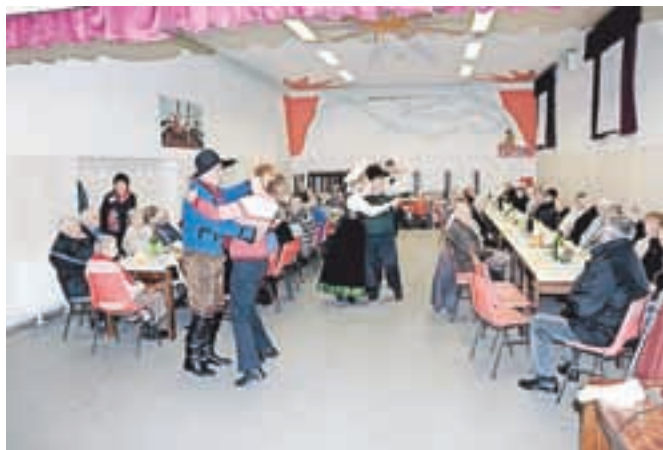
Zabava krajanov Podmežakle s folklorniki Folklorne skupine Triglav

Letos so prvo srečanje pripravile krajevne skupnosti