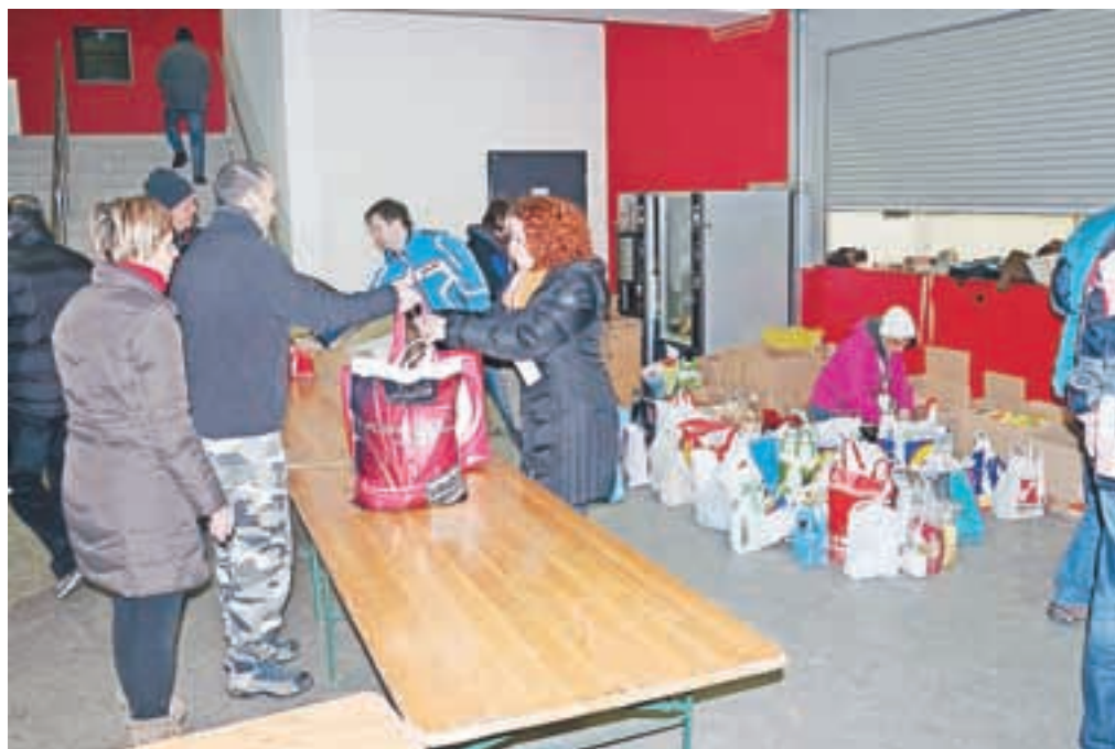
Jeseničani so na tekmo prinesli za več kot dve toni prehranskih izdelkov.

potrebujejo. Mogoče bomo tudi mi kdaj potrebovali pomoč. Hokej je bil tudi ena prvih žrtev krize na Jesenicah in danes je hokej zmagal, ljudje so prišli, pokazali so, da imajo res radi ta šport in da ga na Jesenicah potrebujemo. Upam, da ga bomo čim prej tudi spet imeli.” Kot zaključuje Avdič, dogodki zadnjih let kažejo, da običajnim ljudem v stiski nihče ne bo pomagal, razen soljudi, zato se še posebej zahvaljuje vsem posameznikom, pa tudi številnim jeseniškim