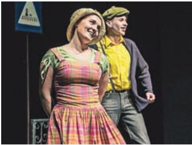
Tinka in Tine v predstavi Hišica v gozdu