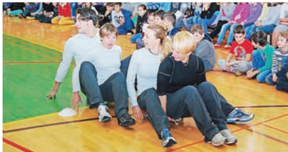
Obisk pripadnikov športne enote Slovenske vojske

učenci na šoli. Učenci v podaljšanem bivanju so gostili prostovoljce iz Finske, Irske in Srbije, ki so učencem predstavili največje znamenitosti svojih držav. Skupaj so se pogovarjali, peli in plesali, izdelovali plakate in se v sproščenem vzdušju tudi kaj naučili. Na božično-novoletnem bazarju so prodajali izdelke učencev in učiteljev, zbrane prispevke so namenili za šolski sklad. Za uvod v praznične dni je učence na šoli obiskal čarovnik Roman.