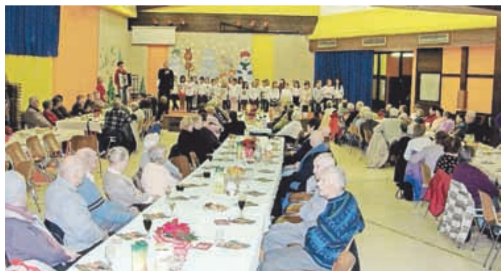
Srečanje krajanov krajevnih skupnosti Mirka Roglja Petka, Staneta Bokala in Cirila Tavčarja