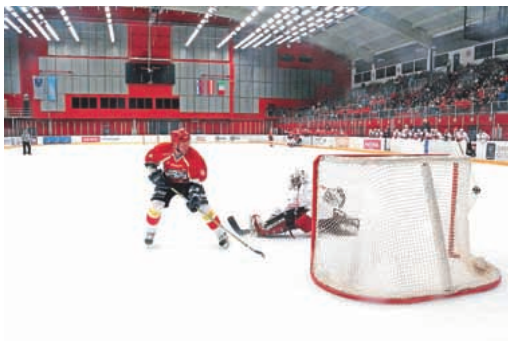
Na dobrodelni tekmi sta se pomerili ekipi Team Jesenice ter ekipa deklet in veteranov.

podjetjem, ki so priskočila na pomoč: “Jesenice so poseben primer, skušajo nas prikazati kot tubobno, umazano mesto, polno brezvoljnih ljudi, vendar ravno na Jesenicah iz dneva v dan dokazujemo, da smo složni, da smo veseli da tukaj živimo in da znamo drug drugemu pomagati. Danes je na Jesenice, kamor pravijo, da sonce nikoli ne posije, to posija lo.”