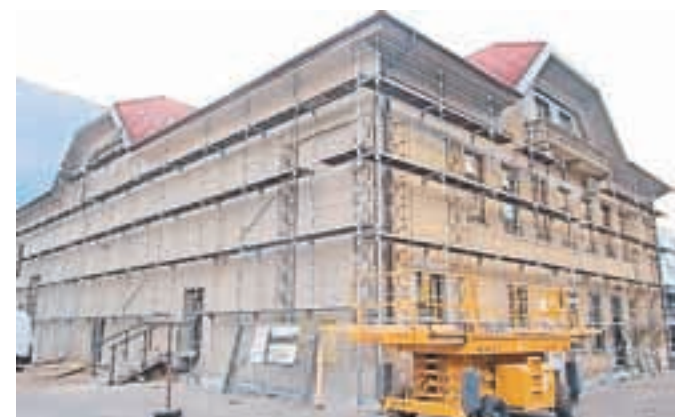
Z grafiti popisano fasado bo zamenjala nova, premazana z antigrafitnim premazom.

Zavoda za varstvo kulturne dediščine Kranj. Spodnji del nove fasade bodo premazali tudi z antigrafitnim premazom, saj so doslej prav grafiti najbolj kazili podobo jeseniškega hrama kulture. Dela naj bi bila zaključena do konca meseca, stala pa bodo nekaj več kot 28 tisoč evrov.