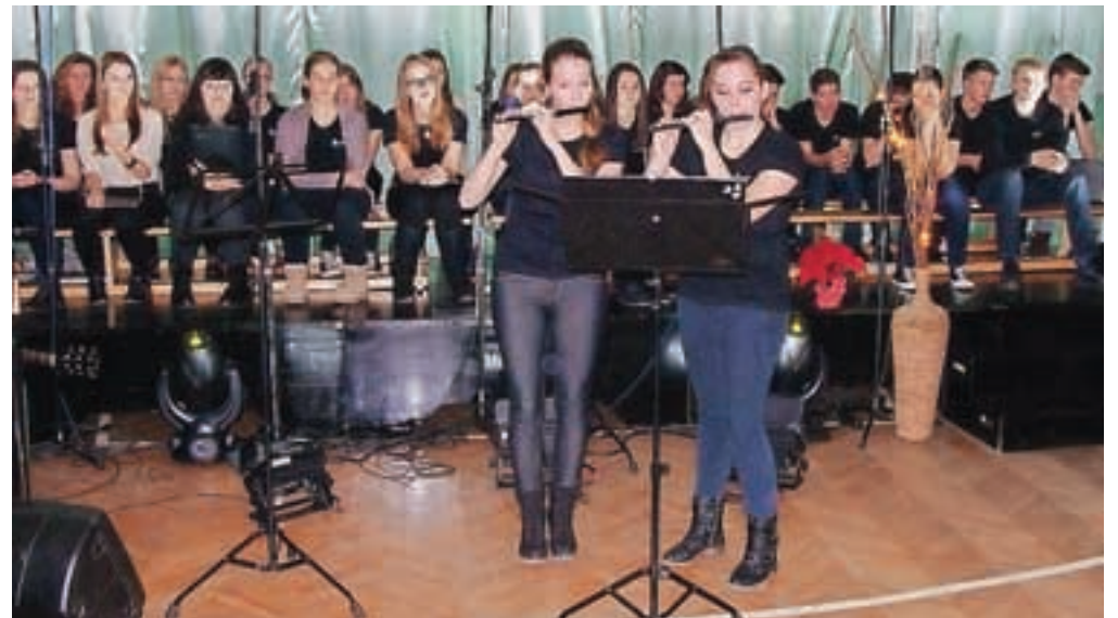
Dijaki Gimnazije Jesenice so navdušili na glasbeno-literarnem večeru.