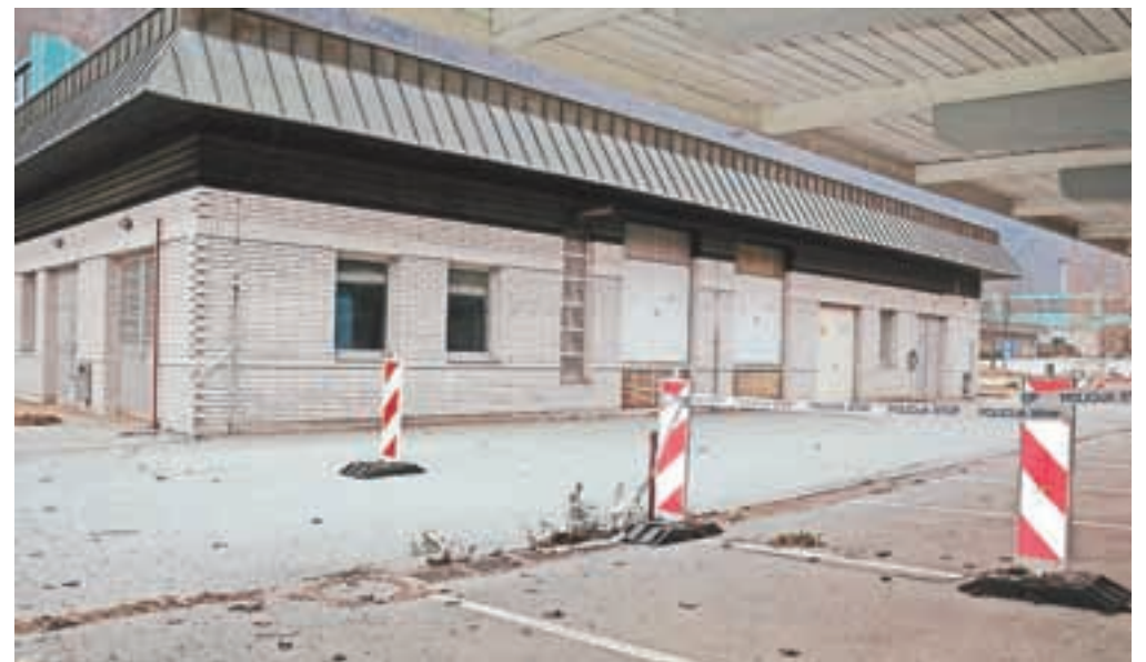
Na nekdanjem mejnem platoju Karavanke že poteka urejanje prostorov za selitev policijske postaje Jesenice.

Kot smo izvedeli, na nekdanjem mejnem platoju Karavanke že potekajo pripravljala dela za selitev policijske postaje Jesenice v prenovljene prostore. Policijska postaja na Jesenicah se že vrsto let spopada s težavami zaradi neprimernih prostorov, kjer policisti nimajo primernih prostorov za delo, neprimerno so bile tudi garderobe policistov, v nekaterih prostorih pa so pred leti odkrili celo podgane. Tiskovni predstavnik policijske uprave Kranj Bojan Kos je potrdil, da na Karavankah poteka urejanje prostorov, kamor se bodo predvidoma v prvi polovici prihodnjega leta preselili policisti Policijske postaje Jesenice in Enota vodnikov službenih psov. Kot še dodaja Kos, bo na Karavankah tudi sedež policijske postaje: "V centru mesta so predvideni še prostori za policijsko pisarno, kar bo dodaten prispevek k optimizaciji poslovanja poli-