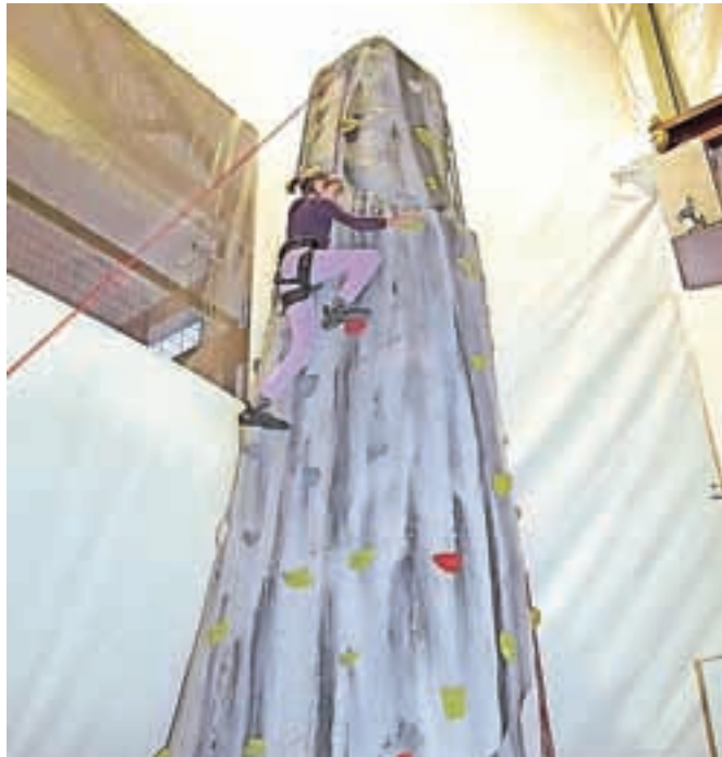
Šestmetrski plezalni stolp za otroke; v ozadju zaščitna zavesa, ki prostor ločuje od ostale tržnice.