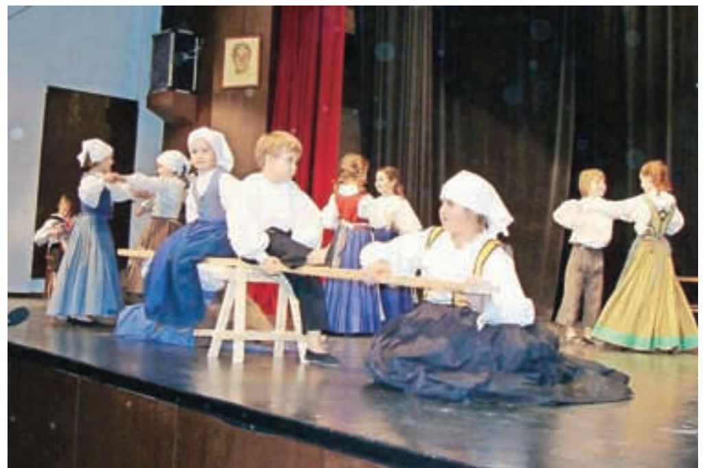
Pohod Triglavčanov so zaokrožili 7. decembra v Kulturnem domu na Slovenskem Javorniku. Na sliki otroška folklorna skupina Mali Triglav.