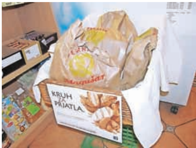
Kruh iz posebne košare, označene z napisom Kruh za prijatla, lahko brezplačno vzamejo vsi, ki si ga ne morejo kupiti.