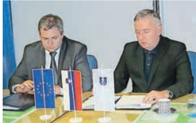
Minister Dejan Židan in župan Tomaž Tom Mencinger ob podpisu pogodb o sofinanciranju

Občino Jesenice je obiskal minister za kmetijstvo in okolje Dejan Židan, ki je z županom Tomažem Tomom Mencingerjem podpisal pogodbo o sofinanciranju v okviru projekta Odvajanje in čiščenje odpadne vode v porečju Zgornje Save in na območju Kranjskega in Sorškega polja – 1. sklop, Izgradnja kanalizacije in nadgradnja ter rekonstrukcija Centralne čistilne naprave v občini Jesenice. Podpisala sta tri pogodbe, in sicer za izgradnjo primarnega in sekundarnega omrežja za odvajanje komunalne odpa-