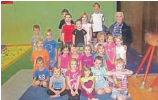
Skupina začetnikov na OŠ Toneta Čufarja Jesenice