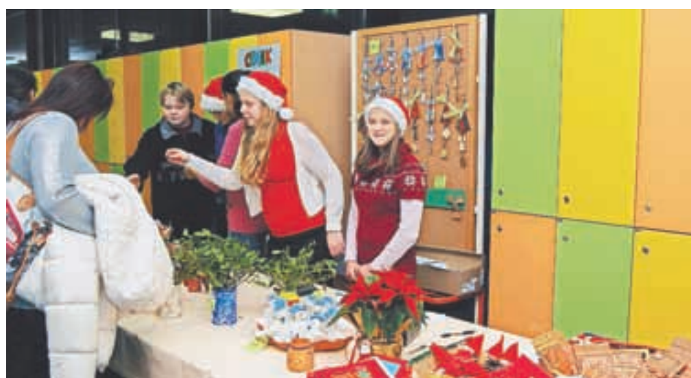
Božično-novoletni bazar